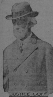
EL JUEZ GOFF

a quién corresponde condenar a la última pena al Teniente Becker.