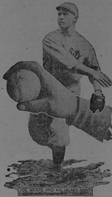
JOE WOOD AND HIS SALARY HAND Joe Wood, el "Humiento" es el mejor "pitcher" de los "Red Sox", los famosos jugadores de base-ball que están disputando en Boston a los "Gigantes" el campeonato mundial. El "Humiento" tira las bolassas curvas, de tal manera, que casi no se ven y los Gigantes no pueden "batear." A nuestros aficionados les interesará conocer a Joe Wood y la manera como toma la bola para arrojársela y hacer sus famosos "Humientos".